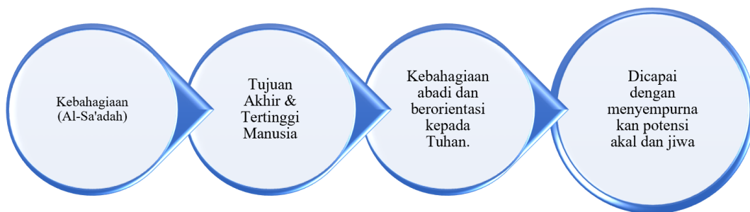
Gambar 1. Konsep Kebahagiaan Menurut Al-Farabi

Dalam pandangan Al-Farabi, terdapat beberapa langkah untuk meraih kebahagiaan. Pertama, melalui niat dan kehendak yang kuat, di mana keinginan yang tumbuh dari dalam jiwa harus diwujudkan dalam tindakan nyata, bukan hanya berhenti pada pemikiran. Kedua, dengan melakukan kebaikan secara konsisten dan berkelanjutan, sehingga tindakan baik tersebut menjadi bagian dari kebiasaan hidup. Ketiga, memahami dan menguasai empat jenis keutamaan, yaitu keutamaan teoritis, intelektual, moral, dan praktis. Keempat, membangun sikap moderat, yakni memiliki keutamaan yang berada di tengah-tengah, tidak berlebihan agar tidak merusak keseimbangan jiwa maupun jasad (Mildaeni & Herdian, 2021a).