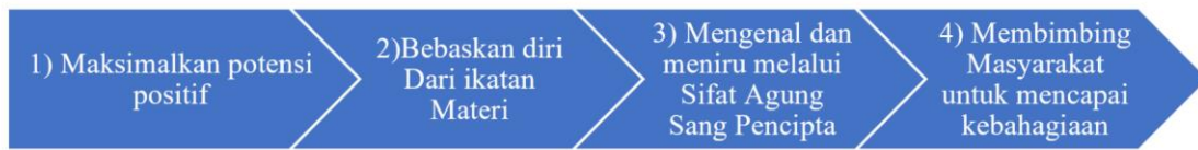
Gambar 3. Jalan Menuju Kebahagiaan Menurut Al-Farabi

Dalam pandangan Al-Farabi, konsep kebahagiaan dikenal dengan istilah al-sa'ādah . Menurutny, kebahagiaan adalah suatu keadaan yang meskipun tidak mudah diraih, tetap menjadi sesuatu yang terus diupayakan oleh manusia. Kebahagiaan dapat dicapai melalui tindakan-tindakan yang baik dan mulia, yang dilatih secara konsisten dan dilakukan atas dasar kehendak serta kesadaran pribadi (Auliati & Hambali, 2023). Al-Farabi memaknai kebahagiaan sebagai kondisi di mana jiwa manusia mencapai tingkat kesempurnaan, sehingga tidak lagi bergantung pada aspek materi untuk eksistensinya. Dalam keadaan ini, jiwa berada dalam kondisi bebas dari keterikatan fisik, dan substansinya terlepas sepenuhnya dari unsur-unsur materi (Izzuddin, 2020). Sementara itu, Al-Ghazali memandang kebahagiaan sebagai transformasi mendalam dalam jiwa manusia yang tidak bergantung pada atau diukur dengan hal-hal yang bersifat material. Jika kebahagiaan hanya dikaitkan dengan aspek-aspek materi, maka pada dasarnya jiwa akan mengalami tekanan atau keterpaksaan. Menurut Al-Ghazali, kebahagiaan sejati hanya dapat dirasakan ketika jiwa terbebas dari ketergantungan terhadap segala sesuatu yang bersifat duniawi atau material (Martin & Hambali, 2023).