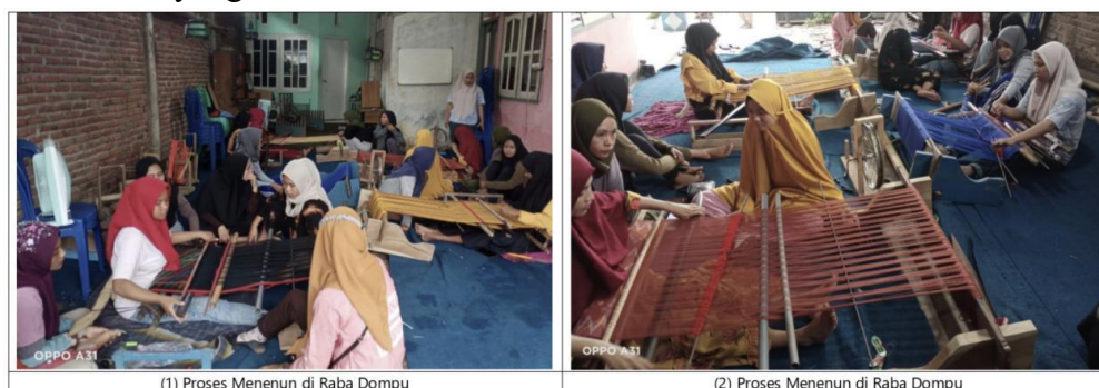
Gambar 3. Kegiatan Menenun di Raba Dompu

Selain nilai lokal Maja Labo Dahu dan Ngaha Aina Ngoho , nilai kearifan lokal Bima yang menuntun kegiatan usaha Tembe Nggoli ialah Kasama Weki atau gotong royong dan Ngahi Rawi Pahu . Untuk diketahui bahwa gotong royong merupakan nilai moral kerja yang melekat dalam kehidupan masyarakat Bima. Karena mengandung dimensi moral, maka nilai kearifan lokal tersebut membentuk etos kerja bersama sebagai fondasi utama. Melalui Ngahi Rawi Pahu membentuk sikap sempurna dalam kepribadian masyarakat terutama dalam kegiatan menenun Tembe Nggoli. Masyarakat yang berusaha Tembe Nggoli di Raba Dompu sebanyak 37 orang, Mereka membentuk komunitas atau kelompok dalam membagi kerja. Setiap anggota kelompok perajin memiliki tanggung jawab masing-masing, saling membantu, dan menjaga kualitas produk secara bersama. Budaya kerja ini tidak hanya mengurangi kesalahan dalam produksi, tetapi juga memperkuat kepercayaan dari pelanggan, sehingga menciptakan peluang untuk pembelian berulang. gotong royong juga menunjukkan bahwa aktivitas menenun bukanlah kerja individual, melainkan bagian dari sistem sosial yang komunal.