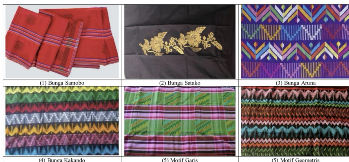
Gambar 2. Motif Tembe Nggoli Ditenun di Raba Dompu

Bukti dari integrasi nilai kearifan lokal Bima dalam Tembe Nggoli adalah makna dari warna dan motifnya. Motif kain tenun yang ada di Raba Dompu Kota Bima dibagi beberapa jenis. Pertama , Bunga samobo. Kedua , Bunga Satako (Bunga Setangkai). Ketiga , Bunga Aruna. Keempat , Bunga Kakando. Kelima , motif Garis. Terakhir , motif geometris yang terdiri dari (Nggusu Tolu, Nggusu Upa Pado Waji, Nggusu Waru). Motif-motif tersebut mempunyai makna yang berkaitan dengan kepercayaan kepada Allah SWT dan kehidupan sehari-hari atau alam sekitarnya. Motif Tembe Nggoli mencitrakan relasi atau hubungan masyarakat Bima dalam tingkatan kehidupannya yaitu tingkatan pertama yakni hubungan kepada Tuhan, tingkatan kedua hubungan antar manusia dan yang tingkatan paling bawah hubungan antar hewan atau makhluk yang kedudukannya di bawah manusia.