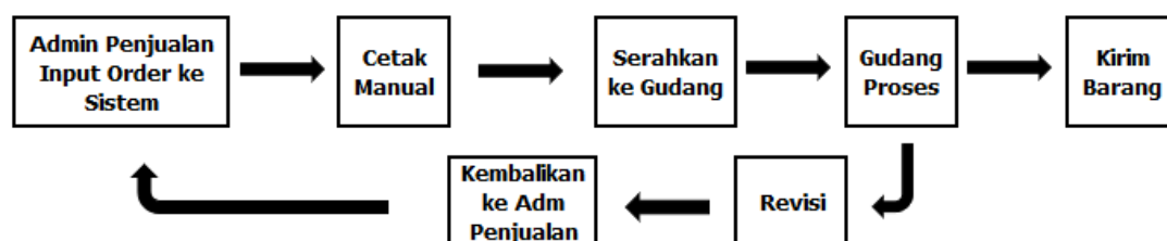
Gambar 1. Alur Transaksi Order Sebelum Menggunakan Sistem Terpadu

Seluruh data yang terdapat di PT Mazzoni Java Utama merupakan data penting bagi perkembangan keberlangsungan perusahaan. Perusahaan menggunakan sistem berbasis desktop yang terintegrasi dengan database terpusat menggunakan MySQL . Pengertian MySQL adalah salah satu jenis database yang banyak digunakan untuk membuat aplikasi berbasis web yang dinamis (Hidayat et al. 2019). Sebelum menggunakan sistem informasi terintegrasi yang menghubungkan seluruh masing-masing bagian di perusahaan, sistem berjalan secara lokal dan data disimpan sesuai bagian masing-masing yang tidak bisa diakses oleh bagian lain. Namun seiring dengan berkembangnya perusahaan dan semakin tinggi tingkat transaksi, sistem tersebut masih belum efisien. Oleh karena itu perusahaan dan tim IT melakukan perubahan pada sistem dengan memberikan akses terhadap data bagian lain sehingga data dari bagian lain dapat diambil untuk digunakan secara langsung atau real time .